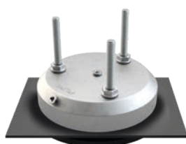
Pièce d'étanchéité DS180 UK I

UK I (Béton) – pour une hauteur d'isolation de 0 à max. 60 mm