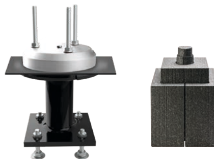
Pièce d'étanchéité DS180 UK II – B 55 – 200

UK II – B (Béton) 55 – 200 – pour une hauteur d'isolation de 55 à max. 230 mm (avec BefTec ® jusqu'à 480 mm possible)